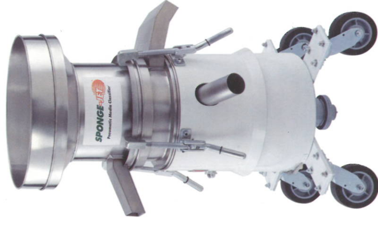
Den sætlig recycler.